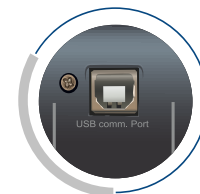
Interfaz de comunicación USB